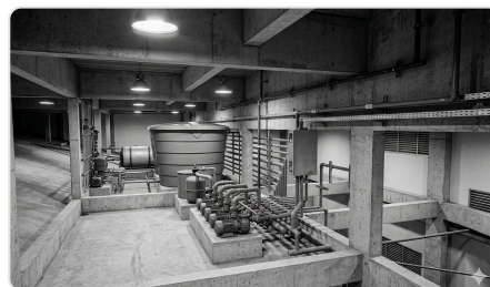
Redes e reservação em BIM nativo