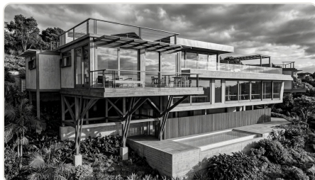
Estruturas em concreto e sistemas mistos