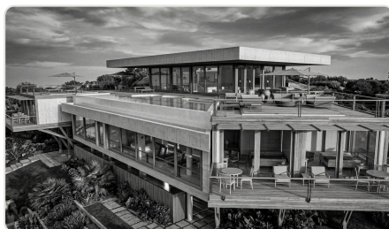
Detalhamento de armaduras em BIM