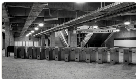
Sistemas, SPDA e telecomunicações