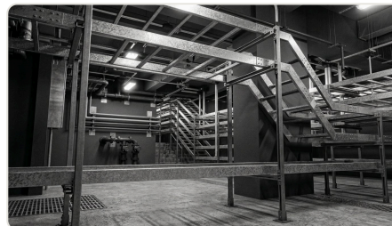
Instalações elétricas e aterramento